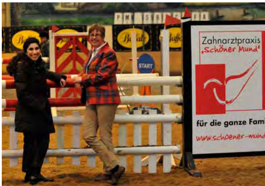
Springturniersponsoren Praxis Schöner Mund

übernommen hat, sondern auch zunehmend die Zügel­führung der Adamstaler Geschäfte übernimmt. Farbliche Akzente sind bereits überall im Hof zu erkennen. Umfassende Renovierungen der Reithalle an der Reiterklause und des Dressur-Aussenplatzes sind noch für dieses Jahr geplant und versprechen für die nächsten Turniere nochmals verbesserte Bedingungen!